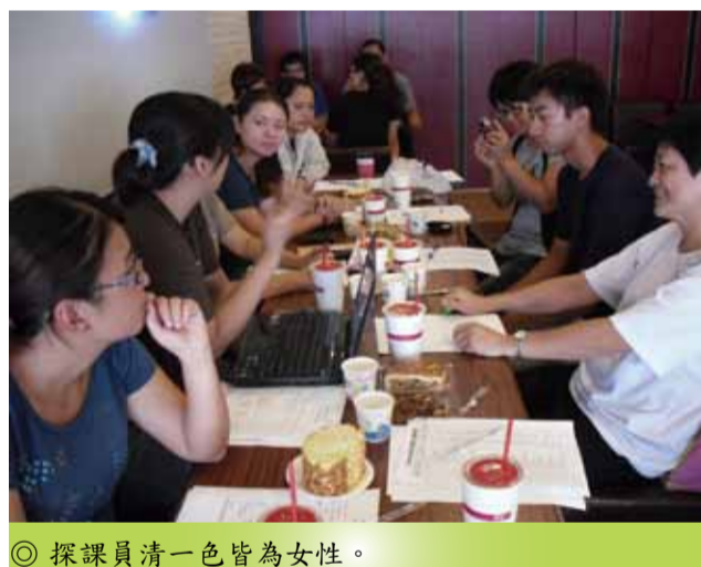
◎ 探課員清一色皆為女性。

七、八月正逢社大放暑假，所有課程都在七月初結束，而我實習的時間選在八月一號至九月中，九月五號社大才開學，所以參與課程進行的時間會在實習的後半段；不過，此時也是社大展開另一個階段的忙碌，這時候除了要處理春季班（旗美社大的課程時間為春季班和秋季班）的成績發送外，還要密切注意秋季班課程的開課進度，旗美社大服務的社群區域在高雄市旗山區九鄉鎮（簡稱旗美地區，範圍涵蓋旗山、美濃、內門、杉林、六龜、那瑪夏、桃源、茂林、甲仙等區，每一區都由一位工作人員負責）。